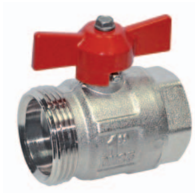
Шаровой кран «бабочка»